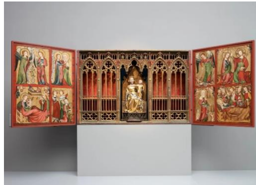
.... wieder im Altenberger Altar (1320-1330)