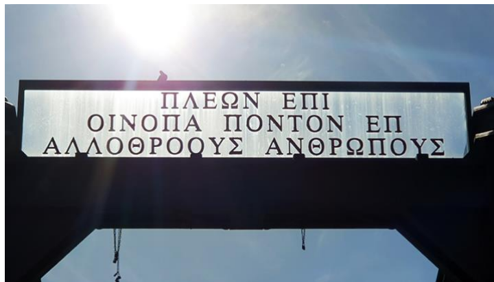
Zitat aus der Odyssee über dem Eisernen Steg in Frankfurt

Enfin, après un déjeuner au marché couvert de la Kleinmarkthalle, nous avons repris le train pour Paris, heureux comme Ulysse !