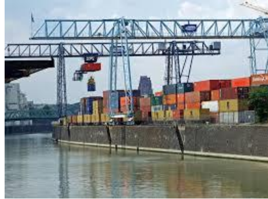
Zone de transbordement des containers