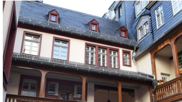
Haus hinter dem Lämmchen