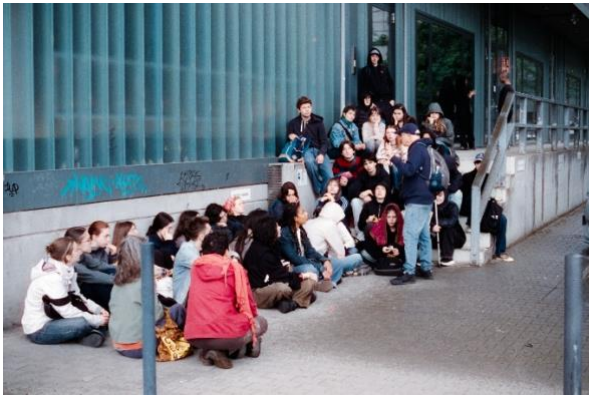
Petite halte pendant l'averse