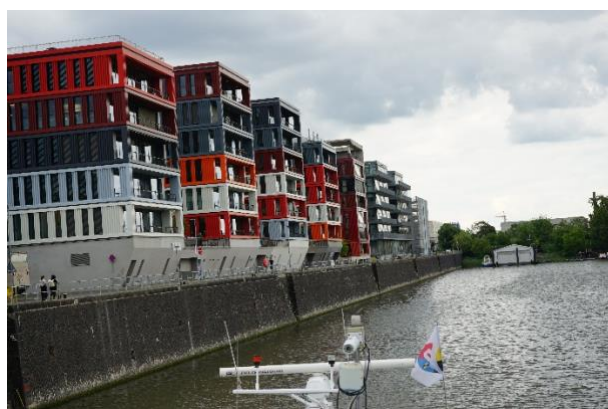
Die « Containerhäuser » am Osthafenbecken