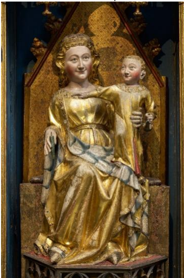
Die Thronende Mutter Gottes...

Jour 2 : Nous avons visité le Städel Museum et ses collections qui vont de la peinture médiévale à l'expressionnisme. La Madone au beau sourire, avec son Enfant aux joues roses, vient d'y regagner l'autel d'Altenberg, et nous avons reconnu dans deux tableaux de Max Beckmann les lieux de Francfort que nous étions en train d'arpenter.