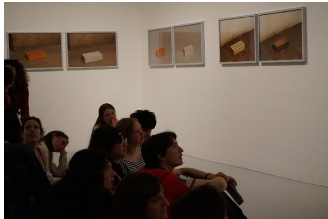
Ausstellung „n+1“ im Foyer der DZ Bank-Kunststiftung