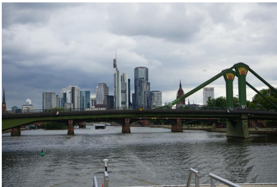
Et à l'arrière : encore et toujours la skyline, avec la cathédrale sur la droite