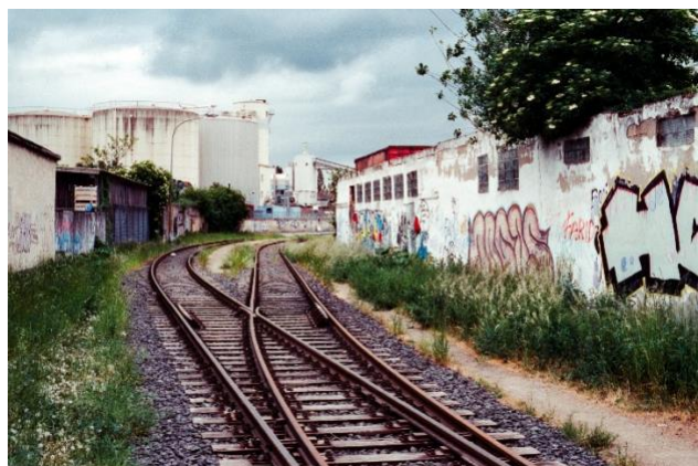
Pendant la traversée du site portuaire