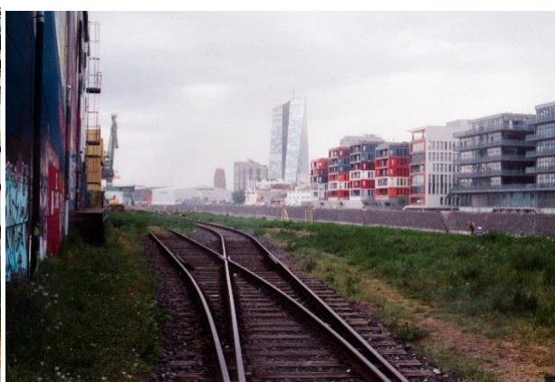
Tout au fond, la silhouette de la BCE