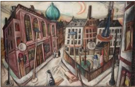
Max Beckmann, Die Synagoge in Frankfurt (1919)