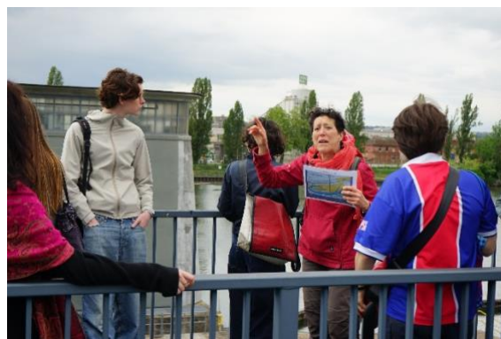
Explications in situ sur les écluses et les ports fluviaux