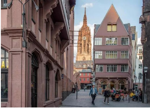
Vue sur la cathédrale, dite aussi « Kaiserdom »

Jour 1 : Nous avons d'abord visité le centre historique pour aller voir la cathédrale (Kaiserdom Sankt Bartholomäus), la place de l'Hôtel de Ville sur le Römerberg, la « Salle des empereurs » et les petites rues où ont été reconstituées, très récemment, des maisons d'époque Renaissance avec parfois un mélange d'éléments architecturaux anciens et modernes.