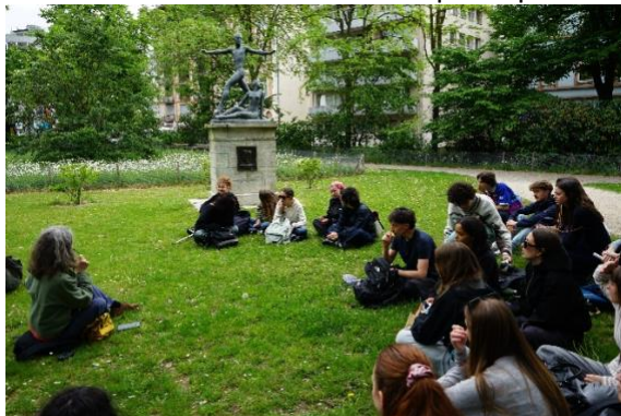
Heine-Denkmal in der Friedberger Anlage

Après une pause près du monument dédié à H. Heine, qui vécut 2 ans à Francfort, nous avons pris le bateau pour nous rendre à la Gerbermühle. De là, nous avons emprunté la passerelle d'une écluse pour rejoindre le site du port fluvial, et traversé le « Osthafen » (port de l'est), où les friches des zones désaffectées alternent avec des espaces portuaires et industriels toujours en activité.