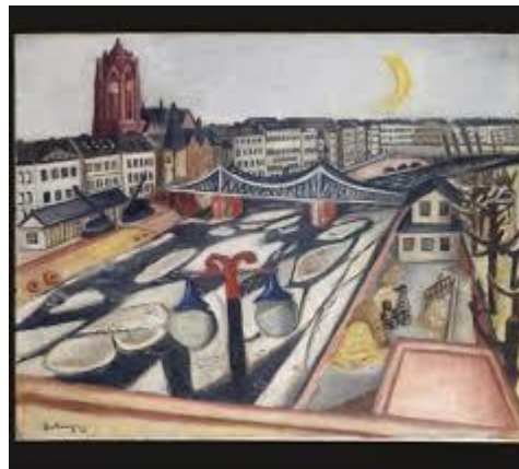
Max Beckmann, Eisgang (1923)