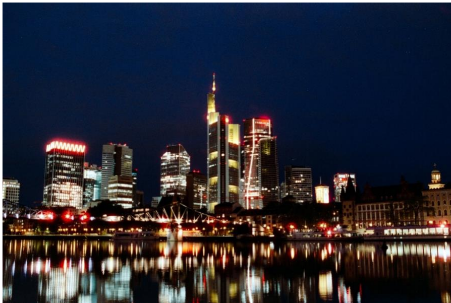
La fameuse skyline du quartier « Mainhattan », photographiée la nuit à notre retour de l'Opéra

Les germanistes de khâgne et d'hypokhâgne ont cette année visité Francfort-sur-le-Main avec leurs enseignants d'allemand et de géographie. L'idée était de partir à la découverte d'une ville qui a toujours joué un rôle crucial dans l'histoire allemande et n'a pas brigué pour rien le statut de capitale de la RFA en 1949. Ville libre d'Empire, elle fut le lieu d'élection et de couronnement de nombreux empereurs du Saint-Empire romain germanique. Elle fut aussi le siège du Parlement fédéral pendant la période du Deutscher Bund et, à ce titre, un lieu marquant de la Révolution de 1848. Après la Seconde Guerre mondiale, l'appui des forces d'occupation américaines permit finalement à Francfort, à défaut de l'emporter sur Bonn, de reconquérir rapidement son statut de capitale commerciale et financière. Sur les ruines de la guerre, se sont édifiés peu à peu les gratte-ciels qui font aujourd'hui sa fierté, et une large part de son identité.