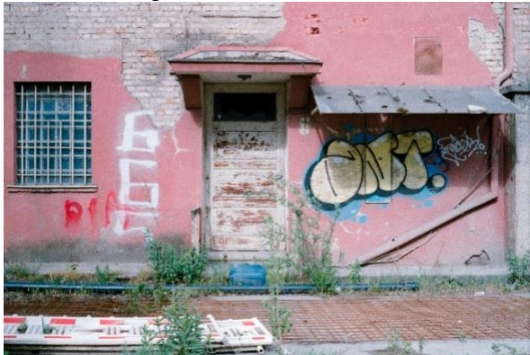
Work in progress