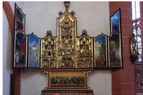
L'un des très beaux retables de St. Leonhard

Nous avons terminé cette première journée dans le cloître des Carmélites : il abrite un très beau jardin intérieur, des fresques murales datant du début du XVIème siècle (mais restaurées au XIXème en style... nazaréen), et enfin l'Institut d'Histoire de la ville, qui présentait cette fois une exposition sur l'américanisation de Francfort après 1945.