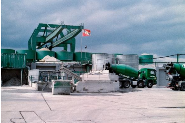
Site de stockage industriel