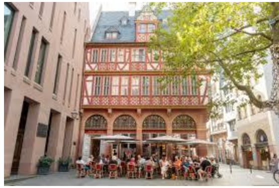
Haus zur goldenen Waage