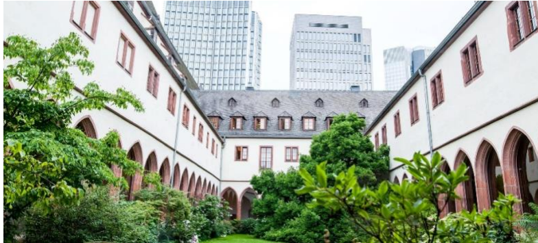
Cloître des Carmélites. Comme souvent à Francfort, l'ancien se cache à l'ombre des buildings.

Jour 2 : Nous avons visité le Städel Museum et ses collections qui vont de la peinture médiévale à l'expressionnisme. La Madone au beau sourire, avec son Enfant aux joues roses, vient d'y regagner l'autel d'Altenberg, et nous avons reconnu dans deux tableaux de Max Beckmann les lieux de Francfort que nous étions en train d'arpenter.