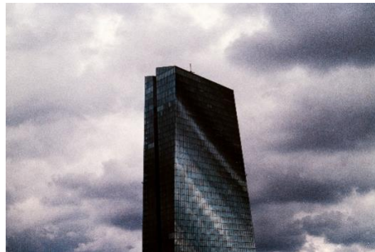
Sur le chemin du retour, le nouveau bâtiment de la Banque Centrale Européenne, dressé dans la tourmente...

Et le soir, diner dans une « Apfelweinwirtschaft » pour reprendre des forces !