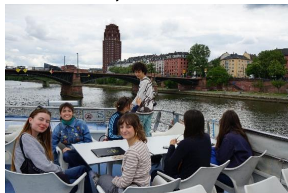
Sur le bateau, direction Gerbermühle